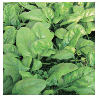
ご主人が作る こだわりの野菜

鶏肉のトマト煮、煮もの、玉ネギの蒸し料理、みずの美しう油漬、 ホウレン草のおひたし、焼きナス、オクラとカボチャの茎のおひたし、 カボチャしらす入あんかけ、春雨の酢のもの、 とうめん、地うりとナスの漬物、 おやつに手作りのあやき、コウがあて甘い枝豆