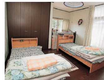
寝室は洋室と和室がある