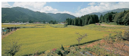
ベランダから眺める、山に囲まれた田園風景