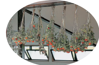
たくさんの ドライフラワー