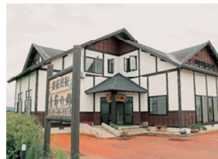
田園にポツリと 際立つ館