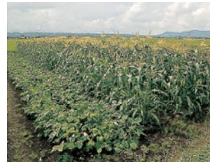
たわわに実る農作物