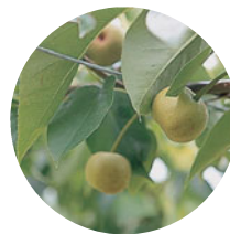
今年も豊作の梨畑