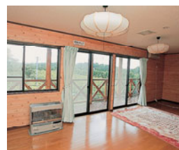
部屋はきれいで、自由に使用可