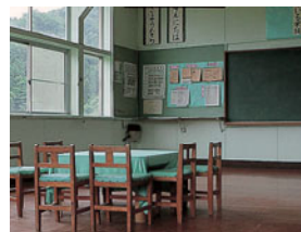
教室がそのまま活用される