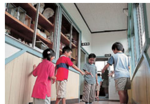
あちこちで交流が行われている