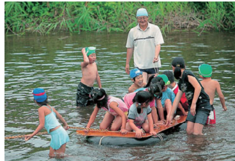
川遊びではしゃぐ子どもたち