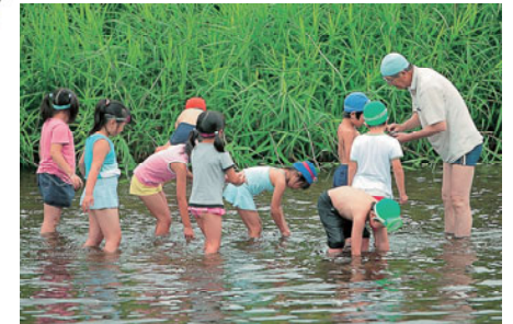
川で自然学習が行われる