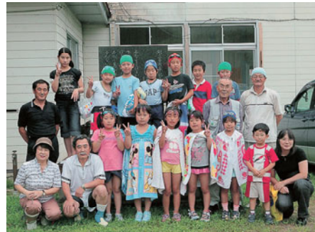
交流体験の子どもたち