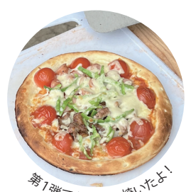
第1弾でもピザを焼いたよ！