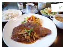
かづの牛ステーキランチ 2,000円。デザートコーヒー付。