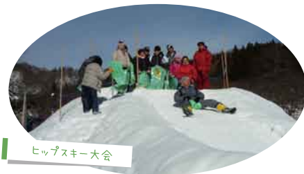
ヒップスキー大会

校舎に足を踏み入れた瞬間、時間の流れが変わるような懐かしく温かい「鹿角市中滝ふるさと学舎」。鹿角地域の交流拠点施設として季節に合ったイベントも開催しています。