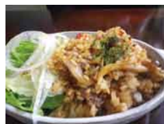
ワンコイン(500円)で食べられる「かづの牛ピラフ」はお手頃!