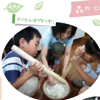
きりたんぼ作り中!