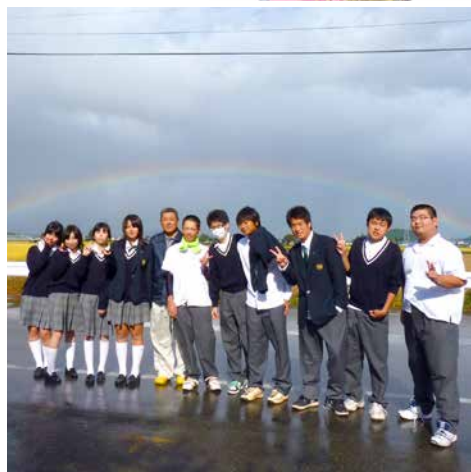
田沢湖・角館・大曲エリア

受入団体：大森町グリーン・ツーリズム推進協議会 住所：横手市大森町字大中島268 (事務局：横手市大森地域局 産業建設課) TEL:0182-26-2116 FAX:0182-26-3200