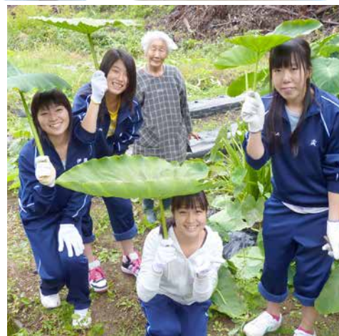
田沢湖・角館・大曲エリア

受入団体：美郷町都市農村交流推進協議会 住所：仙北郡美郷町土崎字上野乙170-10 (事務局：美郷町役場 農政課) TEL:0187-84-4908 FAX:0187-85-3886