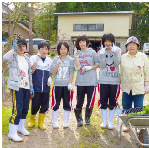
横手・湯沢エリア