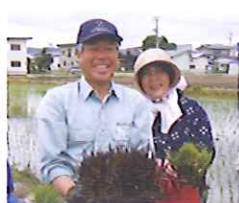
米(マイ)サラダハウス