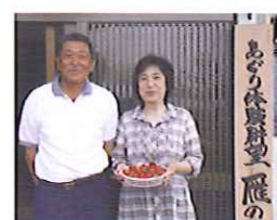
あぐり体験耕望「雁の里」