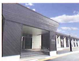
美郷町宿泊交流館「ワクアス」