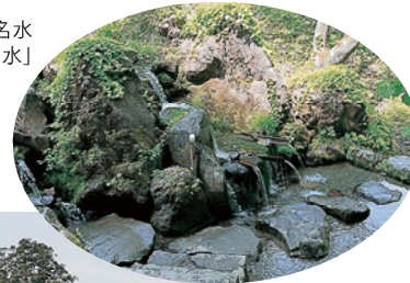
八塩山名水 「ポツメキ湧水」