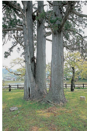
三本に分かれる幹の大杉