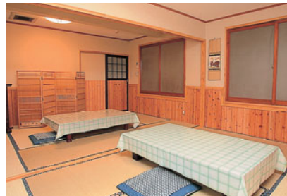
別棟にある食事処