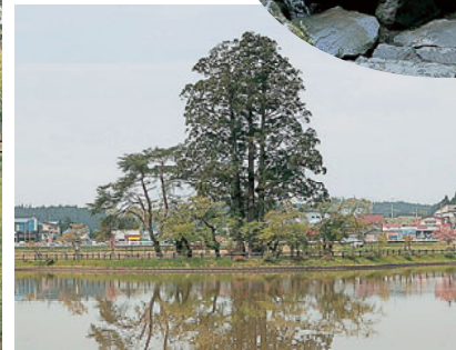
4本の幹からなる大杉