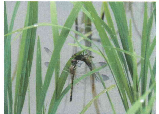
・7月上旬、田んぼで成虫になったばかりのトンボ