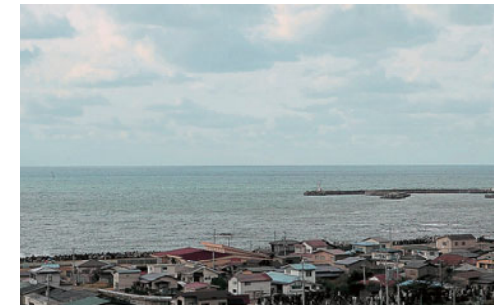
眼下に広がる日本海