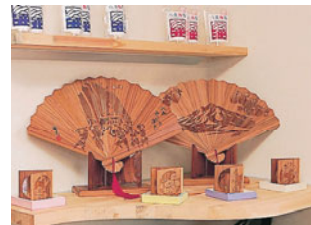
地元の人がつくる 小木工の飾り扇子