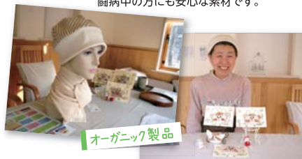
オーガニック製品

手前のログハウスが「ゆるるん直売所」。奥にあるのが「リラックスルーム」。四季折々の自然に囲まれて、秋田産、いやしとぬくもりの空間です。