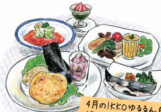
4月のIKKOゆるるん自然食 (月ごとに旬の野菜メニューは変わります)

人をなごませる「オーガニック寅ピーパッチ」。製作体験：約2時間。材料費1個1,200円。2名様から、希望日の1週間前までに予約してください。製作後、スイーツ&お茶タイムあり。