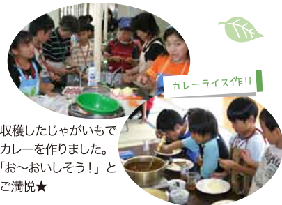
カレーライス作り!