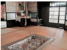
農家のシンボル「囲炉裏」