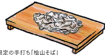
限定の手打ち「松山そば」