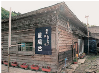
里山に風情を帯びる民家