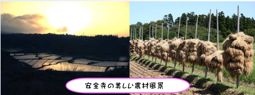
安全寺の美しい農村風景