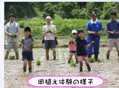
田植え体験の様子